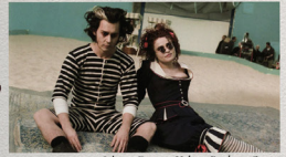
Johnny Depp et Helena Bonham Carter lors du tournage de Sweeney Todd - 2007